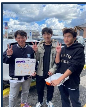
←アンケートも実施しました