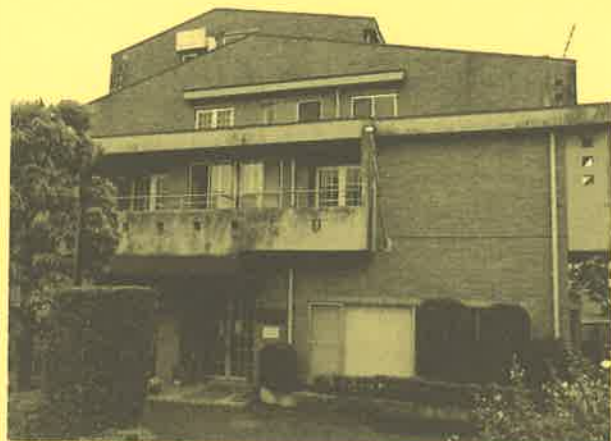
鉄筋コンクリート4階建 平成元年8月完成

〒157-0066 東京都世田谷区成城1-18-11 電話(03)3415-8836 ファクシミリ(03)3415-8835 収容定員 73名(予定)