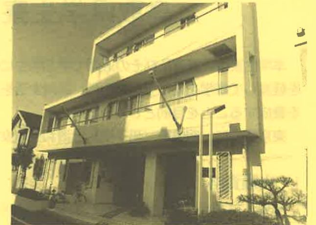
鉄筋コンクリート地上3階地下1階建 平成5年10月完成

〒171-0031 東京都豊島区目白4-34-6 電話(03)5982-1658 ファクシミリ(03)5982-1416 収容定員 74名(予定)