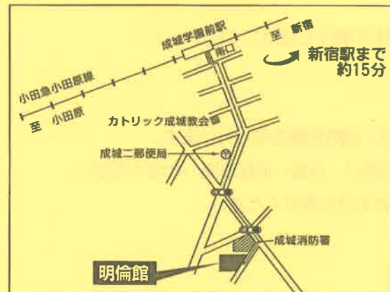
小田急小田原線成城学園前駅下車 徒歩7分